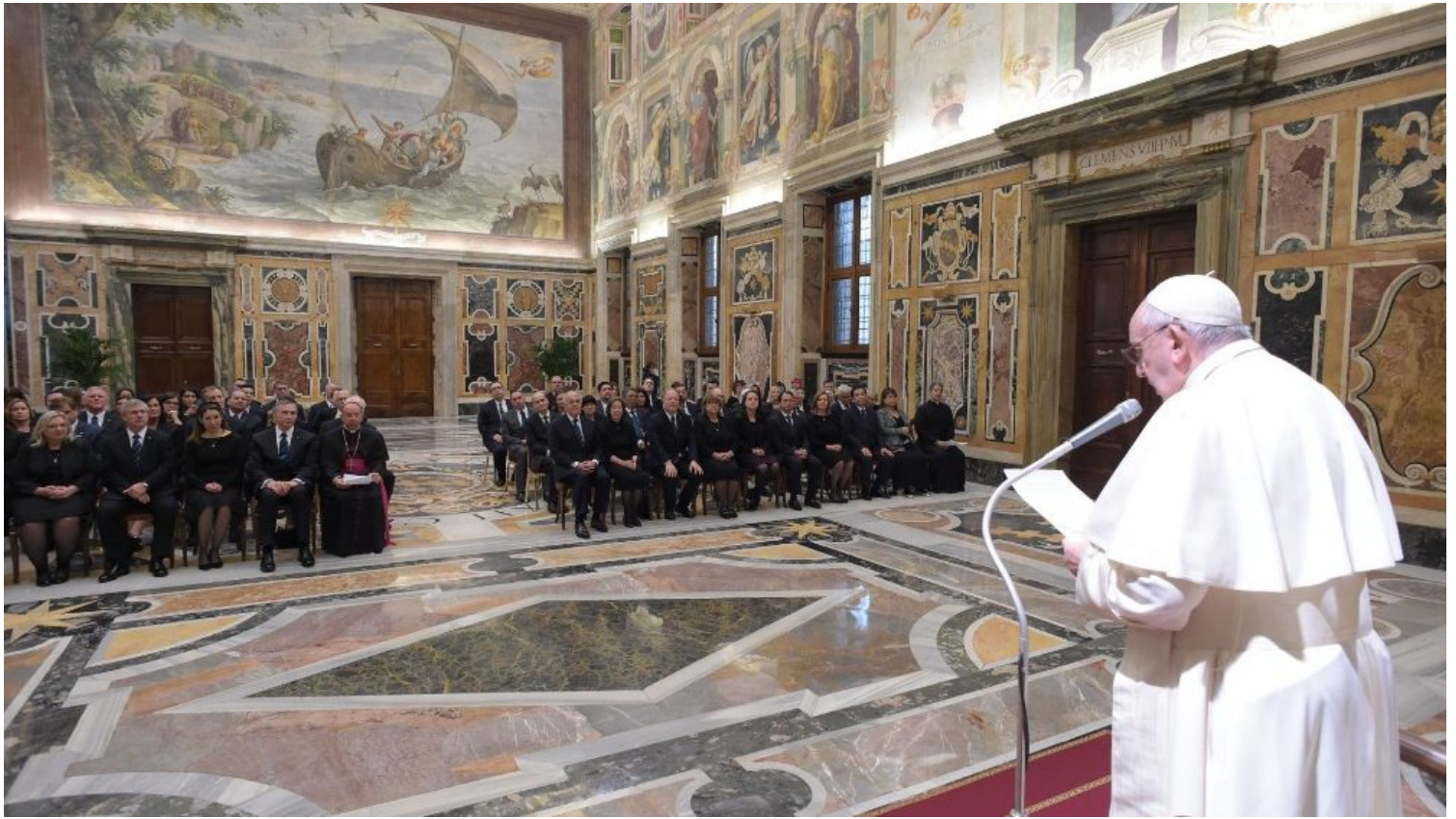
Udienza del Papa ai Cavalieri di Colombo